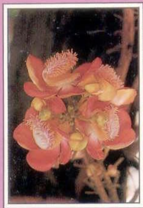
ตามรอย ปฐมสังฆรัตน์