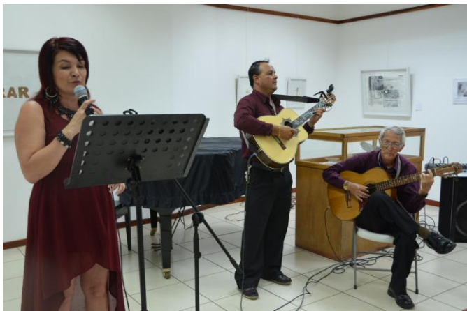
Trío "Rocío musical"

Como un regalo a las madres ramonenses, tres músicos del cantón se unieron para ofrecerles una serenata.