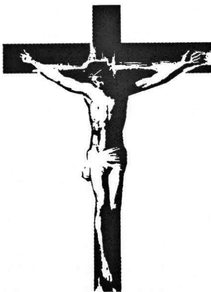
Jesus on Cross Stencil www.spraypaintstencils.com