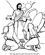
Tranh theo hình ảnh của Đức Giê-su Chúa Giê-su Kitô